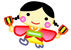
日本銀行高知支店キャラクター おとめちゃん